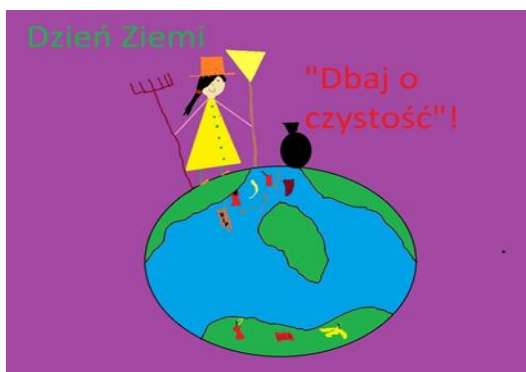
„Dzień Ziemi” - Zuzanna Molik kl. IIa

23 kwietnia 2013 roku z okazji obchodów Dnia Ziemi 2013 odbył się konkurs informatyczny pt. „ Dbaj o Ziemię ”, w którym wzięli udział uczniowie klas II i III. Każdy uczeń miał do wykonania 4 prace w programie Paint. Uczniowie wykazali się dużą wyobraźnią i wykonywali piękne prace graficzne, które wzbogaciły wystawę w sali nr 13 i zostały ocenione w następujący sposób: